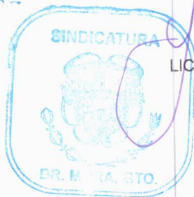
LICDA. YVETTE MEDINA SALINAS SINDICA MUNICIPAL