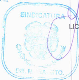
LICDA. YVETTE MEDINA SALINAS SINDICA MUNICIPAL