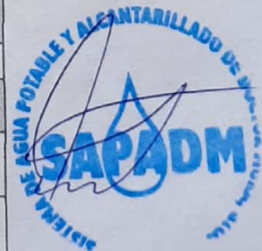
FIGURA JURÍDICA QUE APLICA A SU RESOLUCIÓN