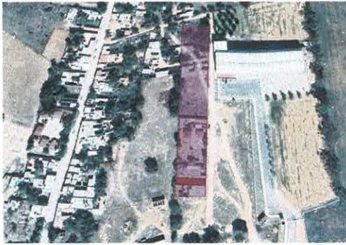
CONEXION A CALLE ESPERANZA (TERRACERIA)