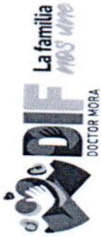
SISTEMA PARA EL DESARROLLO INTEGRAL DE LA FAMILIA DEL MUNICIPIO DE DOCTOR MORA, GTO. ORGANIGRAMA EJERCICIO FISCAL 2022